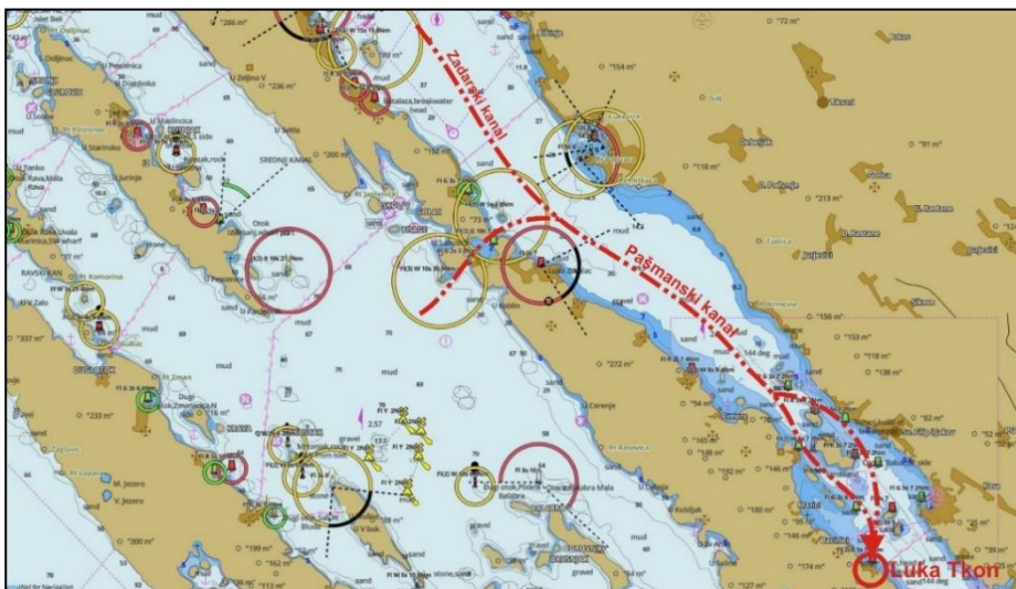
Slika 1. Prilaz luci Tkon kroz Pašmanski kanal U popisu literature se navodi: Portal i-Boating http://fishing-app.gpsnauticalcharts.com (pristupljeno :1. rujna 2023.)

Naslov tablice se piše iznad tablice, a slike i grafikona i dr. ispod u veličini pisma 12. Izvor ili autor slike se prikazuje u nastavku naslova slike ili tablice u zagradama.